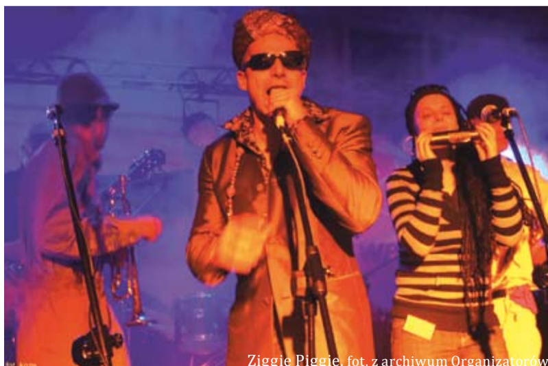
Ziggy Piggie

Szczegóły na materiałach promocyjnych i na www.1200cieszyn.pl