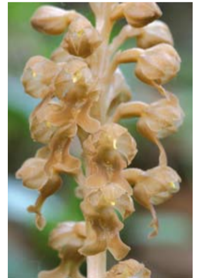
Gnieźnik leśny w rezerwacie „Kopce”