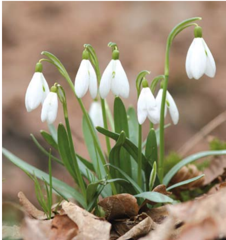
Przebiśniegi nad potokiem Boguniówka

Praktyka pokazuje, że ochrona gatunkowa, jako taka, jest stosunkowo słabym zabezpieczeniem cennych składników przyrody, o czym świadczyć może ustąpienie szeregu chronionych gatunków, notowanych w przeszłości na terenie Cieszyna, jednak szczegółowe zinwentaryzowanie ogółu zasobów roślin chronionych na danym