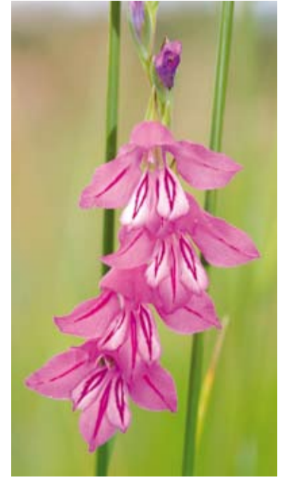
Mieczyk dachówkowaty w Cieszynie Gułdowach

Zdjęcia przedstawiają niektóre chronione gatunki roślin występujące na terenie Cieszyna.