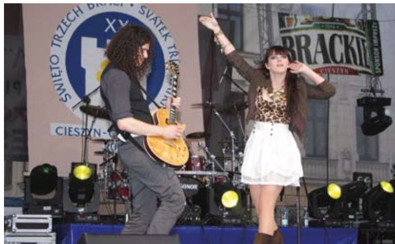
Koncert Ewy Farny