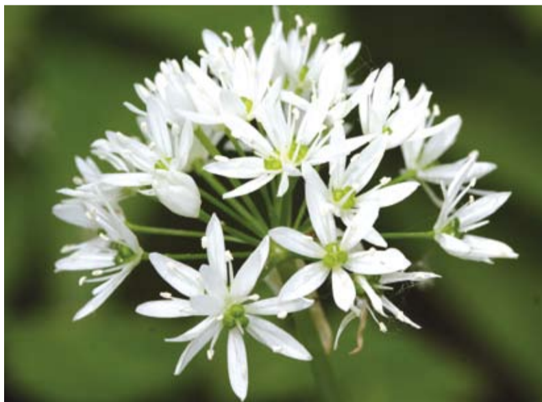
Kwitnący czosnek niedźwiedzi nad brzegiem Olzy w Cieszynie Boguszowicach

terenie i ich okresowy monitoring mogą okazać się pomocnym narzędziem w realizacji zrównoważonego rozwoju, mającego na uwadze rozwój przestrzenny miasta, przy zachowaniu elementów decydujących o jego bioróżnorodności.