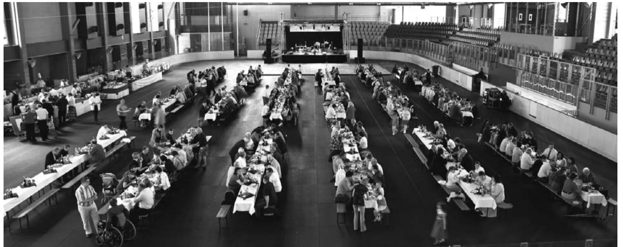
Przyjęcie okolicznościowe w Hali Widowiskowo - Sportowej

Akcja pt. „Energetyka Cieszyńska służy radamieszkańcom miasta”, w tym informacja o firmie i jej dzia-