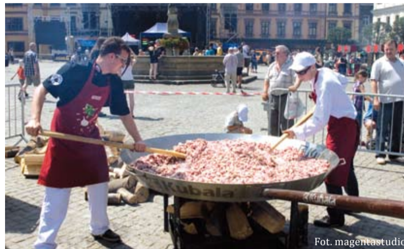
Gotowanie cieszyńskiego gulaszu