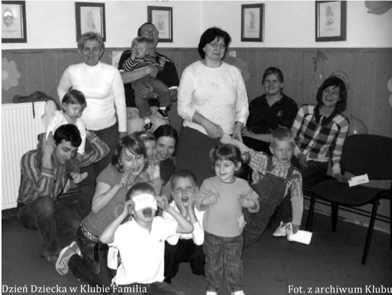
Dzień Dziecka w Klubie Familia