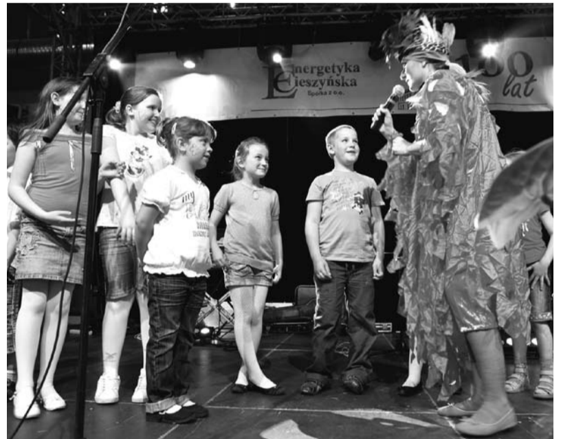
Gry i zabawy dla pracowników EC