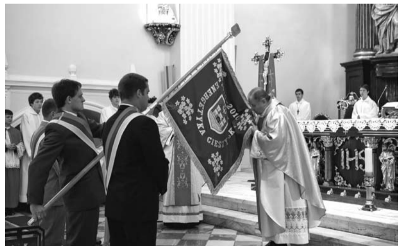
Poświęcenie sztandaru przez biskupa Tadeusza Rakoczego