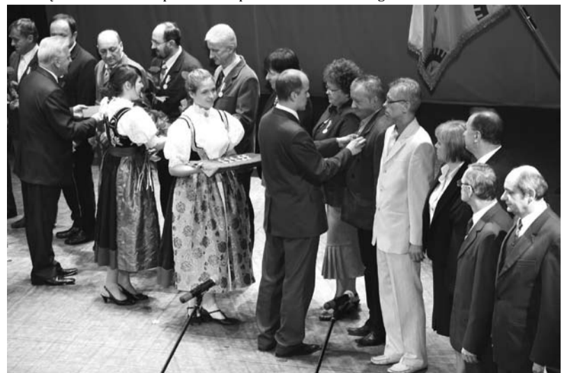
Odznaczanie zasłużonych pracowników