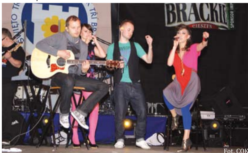
Koncert Natalii Kukulskiej