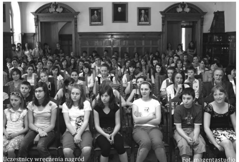
Uczestnicy wręczenia nagród