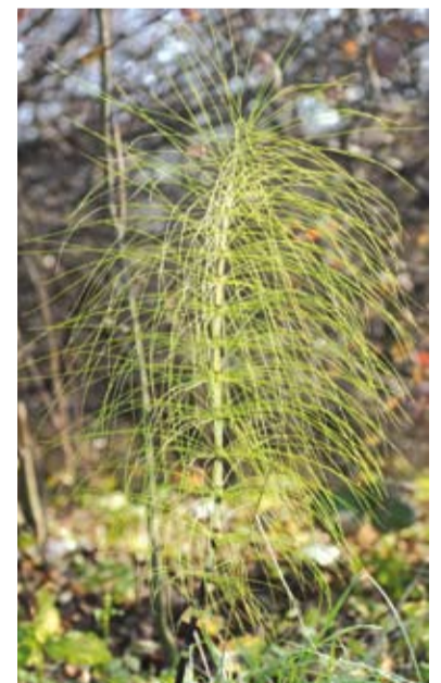
Skrzyp olbrzymi na terenie użytku ekologicznego „Łąki na Kopcach”

Zapraszamy Czytelników do współredagowania tej kolumny. Prosimy o nadsyłanie ciekawostek związanych z Cieszynem (np. anegdot, przepisów kulinarnych, zdjęć, dokumentów, wzorów rękodzieła artystycznego itp.), które mogłyby zainteresować innych i wzbogacić wiedzę o naszym mieście. Gwarantujemy zwrot wszystkich otrzymanych materiałów.