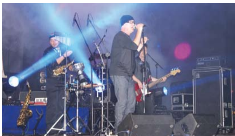
Koncert zespołu De Mono

W dniach 18 - 20 czerwca w Cieszyń i Czeskim Cieszyń odbyło się „Święto Trzech Braci”.