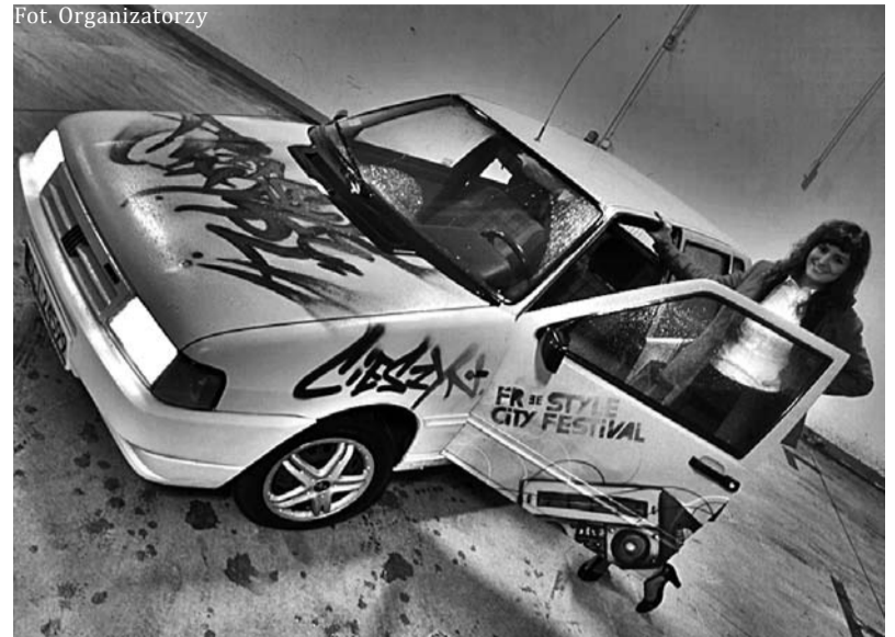
Agata Niedźwiedzka przy swoim aucie

- Akcję przeprowadzał 20 osobowy zespół wolontariuszy. Niektórzy z nas przygotowują się do festiwalu już kilka miesięcy, dlatego udaje się działać szybko i sprawnie - podkreśla Konrad Góralczyk z zarządu wolontariatu.